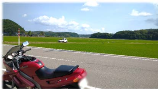
能登のどこかにて