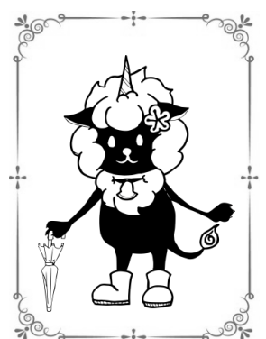
法学類 2年 匿名希望さん