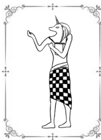
法学類 OG 黒いメンダコさん