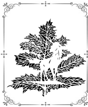
法学類准教授 ○本先生